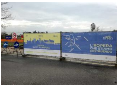
Cartelloni illustrativi lungo i cantieri di Opera Filovia

Lavori per 3 settimane. Più impattante l'intervento nelle vie Giuliani e Tunisi in Borgo Roma. Viabilità modificata