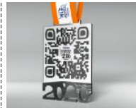
La medaglia con il QR code